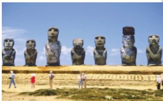
Isla de Pascua, Chile