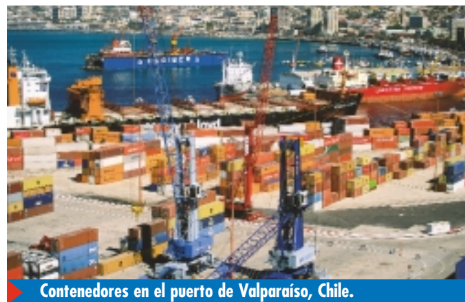
Contenedores en el puerto de Valparaíso, Chile.